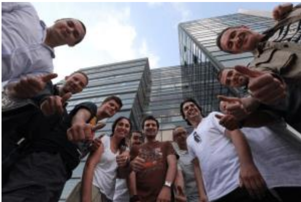
Voyage d'étude Fondation France Israël